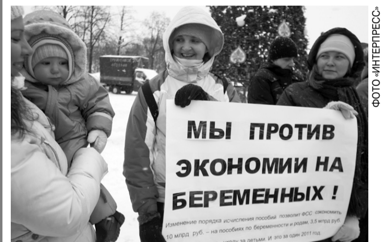
Пикеты помогли — власть обратила внимание на проблему