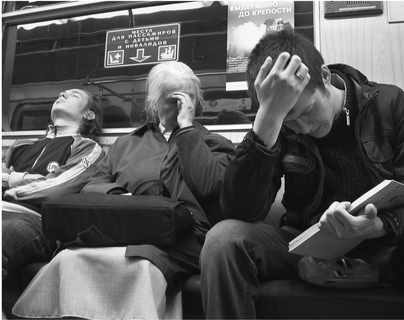
Забота об инвалидах в нашей стране порой ограничивается формальным выделением им особых мест в общественном транспорте