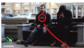
Реклама «Хорошей и мертвой» в фильме «Желтая роза». Нолливуд (Нигерия) 2017 г.

Таким образом, проект интересен людям разных стран и культур, претендует на громкий успех во всех жанрах и регионах.